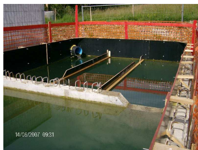
Bac de décantation en sortie du tunnel de Mornay