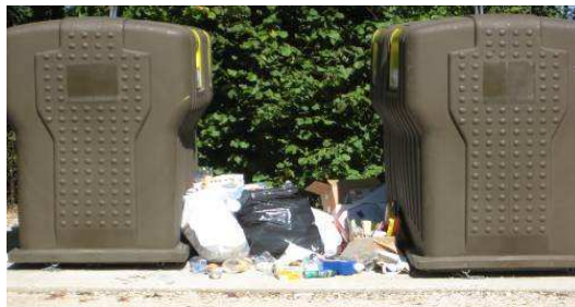
Allée de la Crozette (Cimetière Nurieux)

Avec un peu de civisme, le rêve pourrait peut-être devenir réalité ?